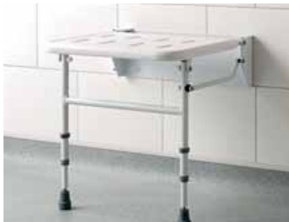
Abbildung oben links im großen Bild, 523 x 469 mm, schwarz/chrom, Aluminium/ABS, Belastbarkeit 150 kg Code: DUKLKP05