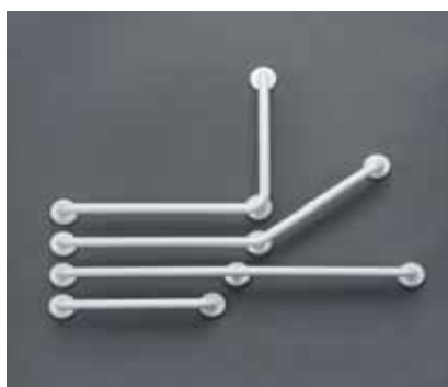
Winkelhaltegriff 90°, weiß