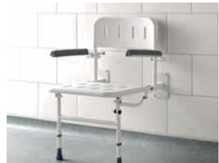
Abbildung oben mitte im großen Bild, 500 x 438 mm, Höhe 460 mm, schwarz/chrom, Aluminium/ABS, Belastbarkeit 150 kg Code: DUKLHP05